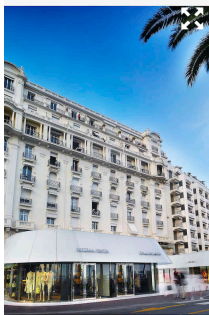
Le 65 Croisette, à Cannes.

Fortement implanté et connu à Marseille, Cannes, Monaco, Courchevel ou Saint-Tropez, le groupe Finamas s'était déjà illustré l'an passé à travers une transaction historique : la vente d'un appartement duplex sur la Croisette à Cannes pour quelque 45 M€, soit 70 000 €/m 2 ! Un record en France. Un investisseur étranger s'est offert ce superbe duplex penthouse de près de 650 mètres carrés, pépite de la résidence First Croisette réalisée par Finamas, sur le célèbre boulevard à Cannes, au pied de laquelle Dolce & Gabbana a installé sur plus de 1 300 mètres carrés son flagship store . Ce dernier doit d'ailleurs ouvrir avant la fin de l'année 2020. Cette opération de promotion résidentielle et commerciale est la vitrine du savoir-faire de la famille Masliah, qui s'était déjà distinguée un peu plus tôt dans l'année avec la vente record du Château Soligny , à Cannes, pour 55 M€. Dans son catalogue, elle compte aussi la galerie commerciale de luxe du 65 Croisette au pied du Palais Miramar ou la luxueuse résidence 87 Soligny . Fort de cette longue expérience, le groupe Finamas décide aujourd'hui d'investir la capitale, et étudie déjà des opportunités sur les marchés du bureau, du commerce et du résidentiel dans le Triangle d'or.